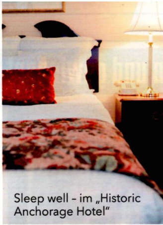
Sleep well - im „Historic Anchorage Hotel“